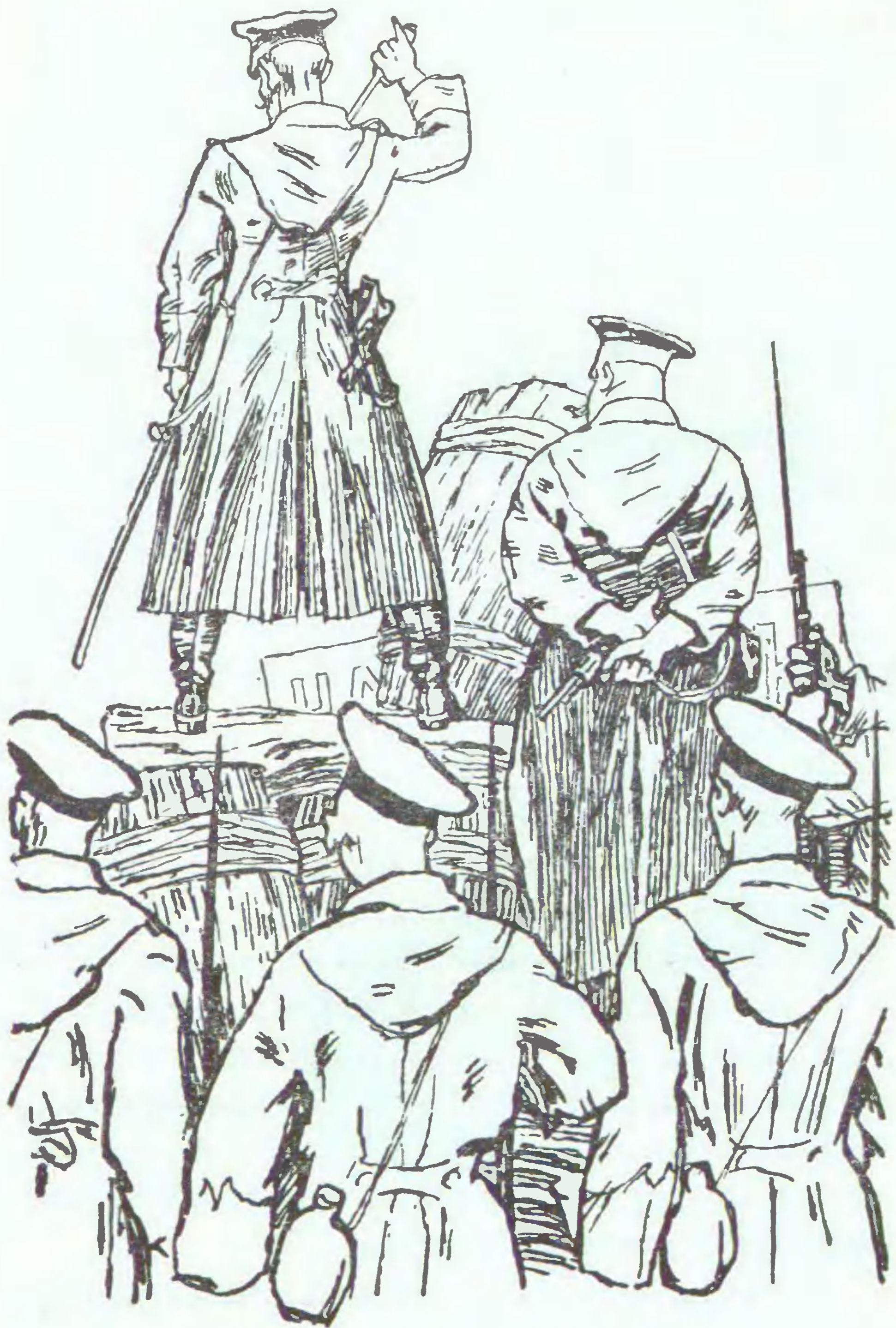
Офицер вложил в ножны саблю...