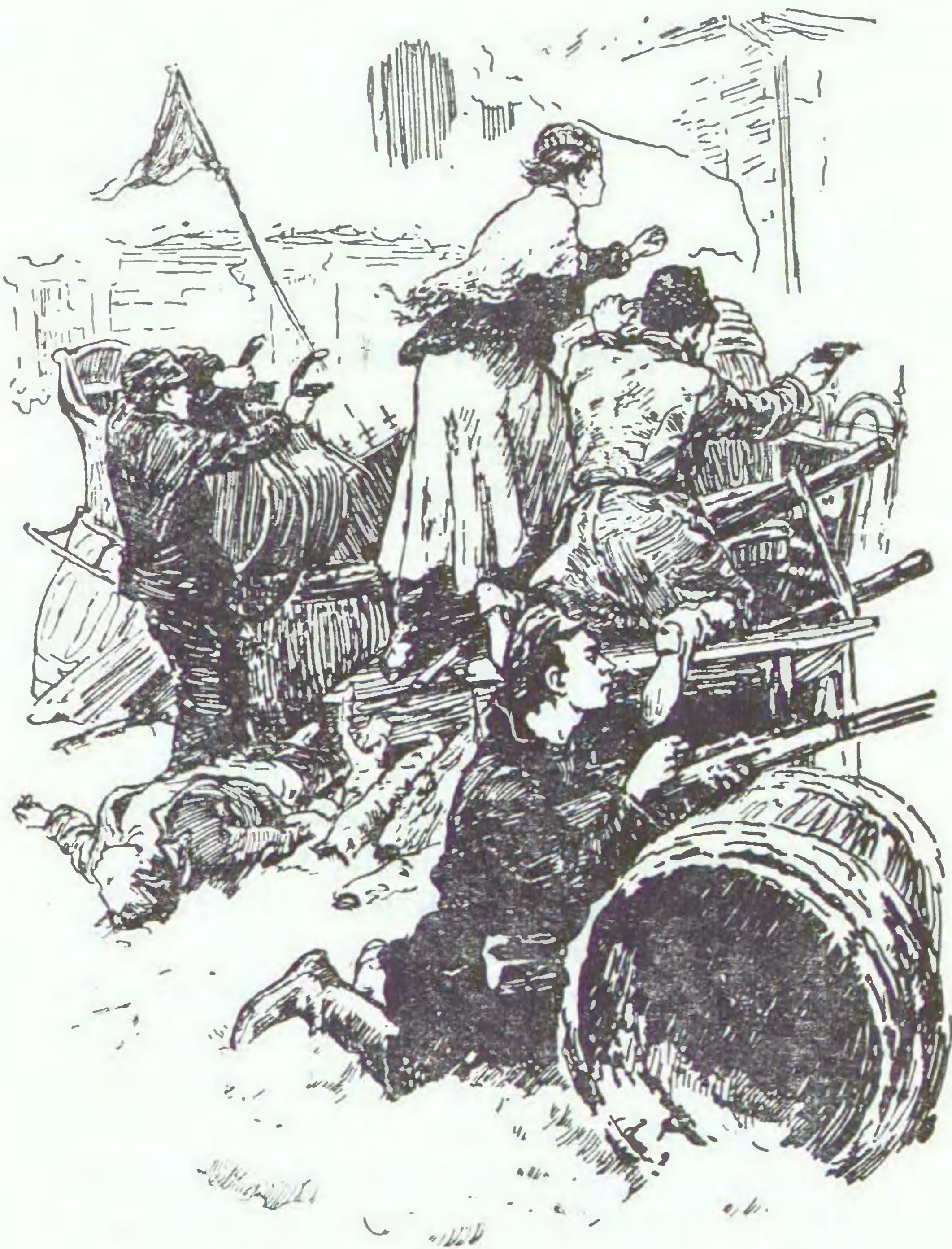
Настюша быстро и ловко взобралась на баррикаду.